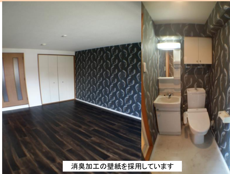
消臭加工の壁紙を採用しています