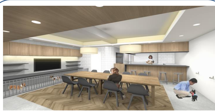
ダイニングスペース