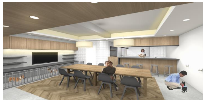
ダイニングスペース