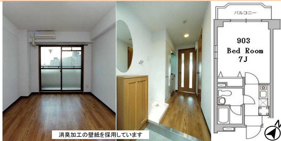
消臭加工の壁紙を採用しています